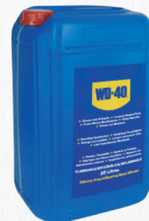
Bidón 25 litros

Garrafa para uso industrial que é acompanhada de um pulverizador para uma aplicação mais simples