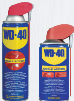
Spray Dupla Acção 250ml e 500ml

O formato flexível permite que você alcance onde outros não chegam sem a necessidade de desmontar a área a ser reparada.