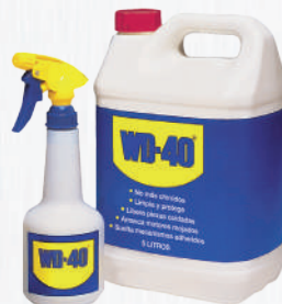
Garrafa 5 litros

O formato Dupla Acção permite uma aplicação ampla ou precisa do produto, garantindo que a cânula nunca se perderá