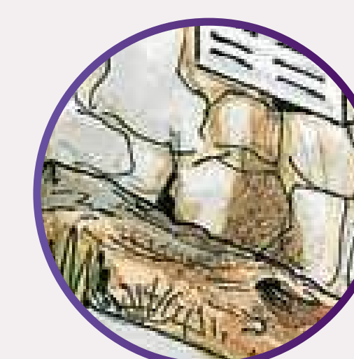
Junto aos muros.