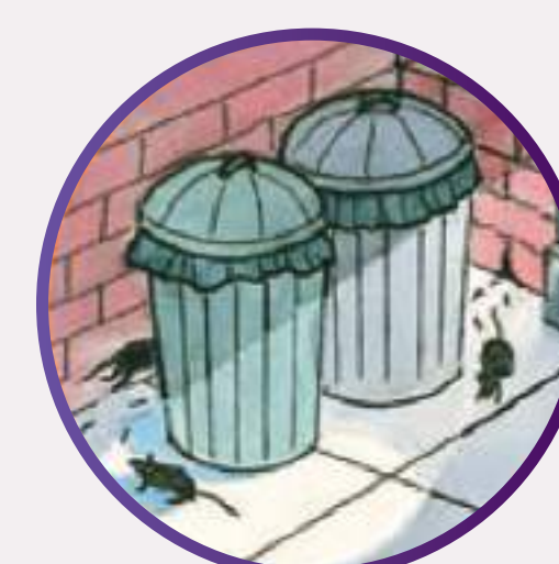
Locais de passagem dos roedores.