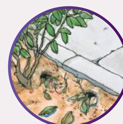
Junto às tocas ou no interior das tocas.